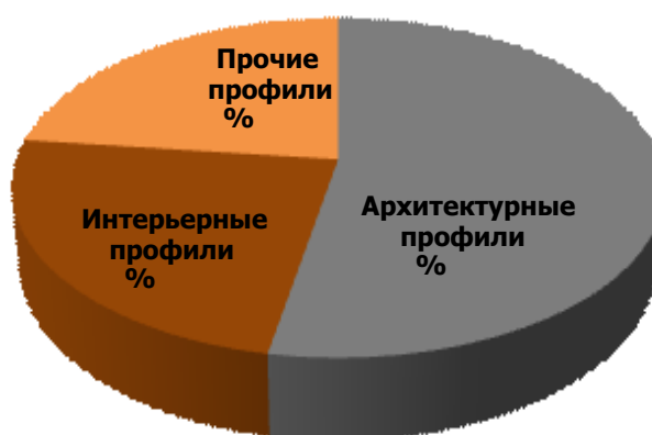
Диаграмма 2. Долевое распределение рынка алюминиевого профиля в разрезе ассортиментной сегментации, 2008 г., РФ, %.