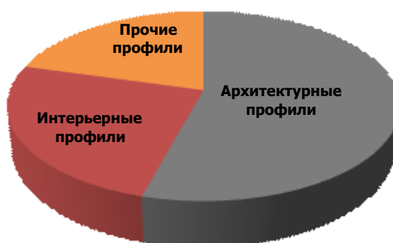
Диаграмма 5. Объема отечественного производства алюминиевого профиля в разрезе ассортиментной сегментации, 2008 гг., РФ, %.